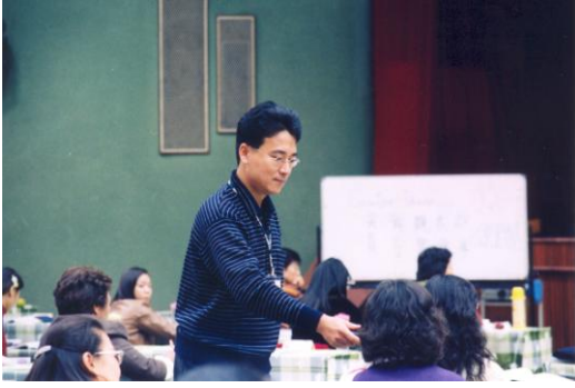
講師下台促進研習教師編輯故事與故事接龍。