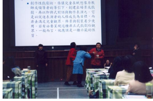
台下接龍故事，台上照故事即興演出。